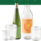
Bocaux, pots et bouteilles en verre