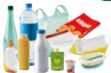
Emballages plastiques & barquettes polystyrènes