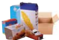
Cartonnettes & petits cartons