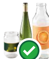
Bouteilles, pots et bouteilles