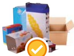
Cartonnets & petits cartons déchirés en morceaux