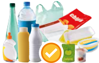
Emballages plastiques & barquettes polystyrènes