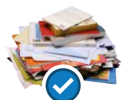
Papiers, prospectus, magazines, etc.