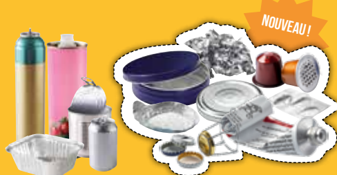
➔ Emballages métalliques