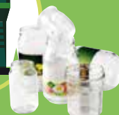
➔ Bocaux et pots en verre