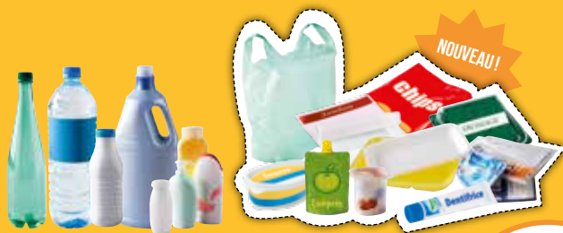
➔ Emballages plastiques