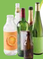
➔ Bouteilles en verre