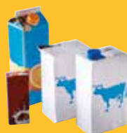
➔ Briques alimentaires