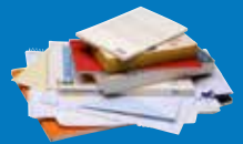
➔ Cahiers, livres, catalogues et autres papiers