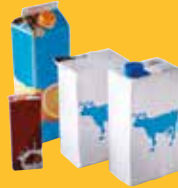
➔ Briques alimentaires