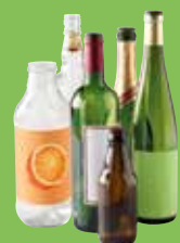
➔ Bouteilles en verre