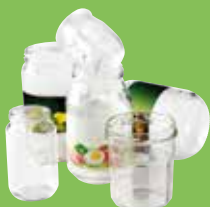
➔ Bocaux et pots en verre