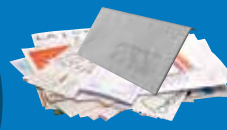
➔ Courriers, enveloppes