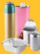
➔ Emballages métalliques