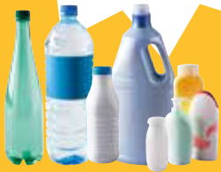
➔ Emballages plastiques