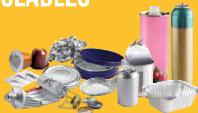
➔ Emballages métalliques