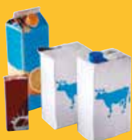
➔ Briques alimentaires