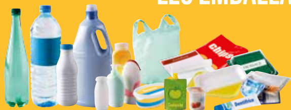
➔ Emballages plastiques